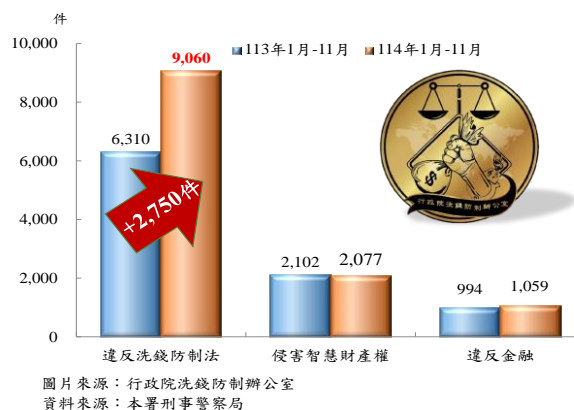
114 年 1 月-11 月查獲主要經濟案件與上年同期比較

警察機關本於行政一體之原則，積極配合政府各目的事業主管機關，全力查緝各類型經濟犯罪，包括侵害智慧財產權、重利(高利貸放)、地下通匯、違法收受存款(吸金)、走私、產製販賣私劣酒、破壞國土、偽造貨幣、洗錢、非法食品及藥物等經濟犯罪案件。本署訂頒「內政部警政署查緝經濟犯罪執行計畫」，彙整各類型經濟犯罪之偵防技巧及程序，以全面防制重大經濟犯罪。茲就 114 年 1 月-11 月及近 5 年警察機關查獲違法經濟案件概況簡析如下：