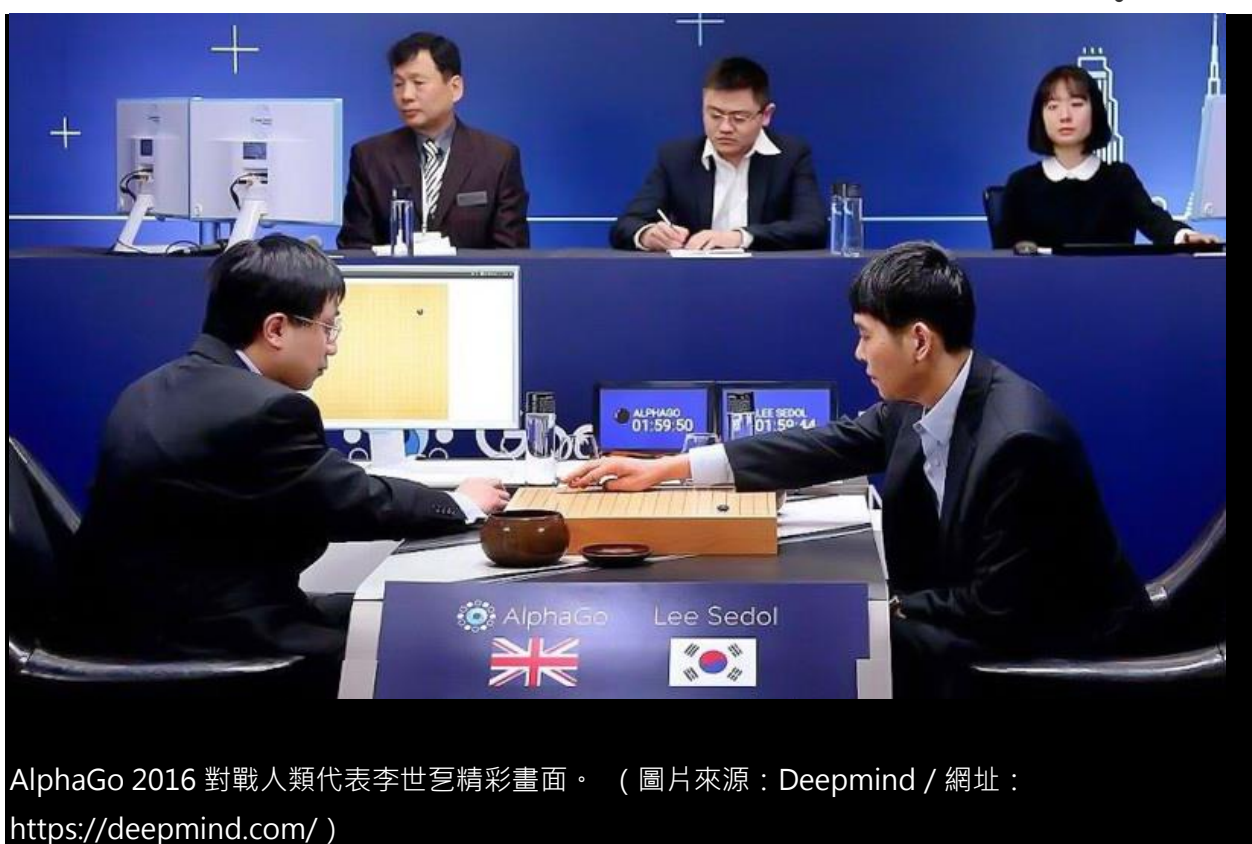
AlphaGo 2016 對戰人類代表李世乜精彩畫面。

圍棋 (GO) 雖然只是由黑白兩色的棋子跟簡單的遊戲規則所組成，但玩法卻千變萬化，因此被公認為最困難的棋類遊戲之一。相較於其他的棋類遊戲，圍棋的每一步棋可以選擇的路徑更多，舉西洋棋為例，每步棋僅有 20 種步法，而圍棋每步棋卻高達 200 種，棋局的可能變化數目比全宇宙所有物質的原子總數（十的八十次方）還要多，即使出動全世界的電腦同時全力運作一百萬年，這樣運算能力也還不足以運算出所有棋局的變