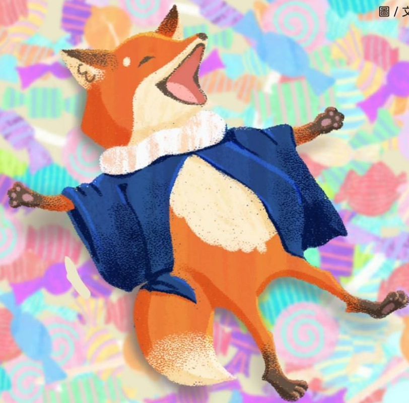
圖 / 文：陳念欣